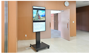
南阿蘇村役場 会議室入口 選挙やイベントがある際は案内板としても活用