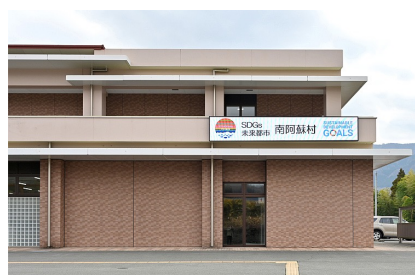
南阿蘇村役場 庁舎正面 横断幕からLEDビジョンに変え、リコーデジタルサイネージで各種コンテンツを表示