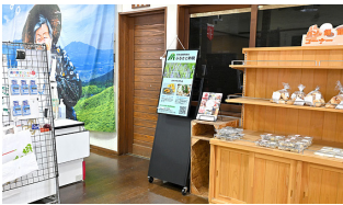
道の駅「あそ望の郷くぎの」旬鮮あじわい館のレン横から情報配信

道の駅「あそ望の郷くぎの」には、地域内外から多くの方が訪れます。お買い物やレジャーに訪れる皆様に、南阿蘇村の魅力をもっと知ってもらうため、道の駅でもリコーデジタルサイネージを活用したいと思いました。地域の特産物を豊富に扱う旬鮮あじわい館に、ディスプレイを設置。ふるさと納税の返礼品としても人気の高い農産物などを紹介しています。また、ディスプレイの横にはふるさと納税のチラシを置き、情報をお持ち帰りいただけるようにしています。