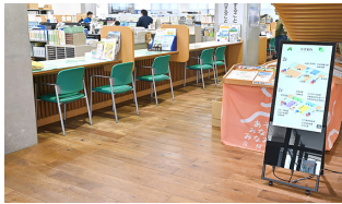
南阿蘇村役場 入口 分かりやすい施設MAPで来庁者を案内

南阿蘇村役場庁舎内に4台、庁舎外壁に1台、道の駅「あそ望の郷くぎの」旬鮮あじわい館に1台、南阿蘇複合施設LOOPに1台を設置しています。庁舎外壁には太陽光の下でも視認性の高いLEDビジョンを採用。それ以外は、選挙やイベントに合わせて柔軟に移動できるようキャスター付きのスタンドを採用しています。