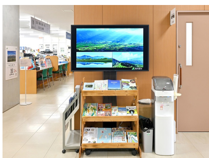
南阿蘇村役場 2階ロビー

世界最大級の広さを誇る阿蘇カルデラ。その南のふもとに広がる南阿蘇村は、「水の生まれる郷」と呼ばれるほど豊かな水源を有し、温泉の泉質も多彩。清らかな湧水で栽培される農産物や放牧地でのびのびと育つあか牛など、美味しい魅力にも恵まれています。南阿蘇村役場様では、こうした村の魅力をはじめ多様な情報を効果的に配信していくためにリコーデジタルサイネージを活用されています。村役場、道の駅、複合施設に計7台を導入。行政手続きの案内から観光情報、Instagramの最新コンテンツまで、様々な情報を村役場から遠隔配信。キャスト付きのスタンドを採用することで、用途に合わせた移動もしやすく、選挙やイベントの案内板としても活用されています。一方、庁舎の外壁には従来の横断幕に変えてLEDビジョンを設置。横断幕の印刷コストや掛け替える手間が不要となり、情報更新に伴う業務負荷が軽減。成人式のお祝いや全国大会出場の応援メッセージなど、タイムリーなコンテンツをダイナミックに展開し、地域の皆様に注目いただいています。さらに、防災/災害情報コンテンツの活用により、万一の災害への備えも強化。災害に強い村づくりにもリコーデジタルサイネージが役立てられています。